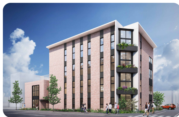
▲ クリニック外観図